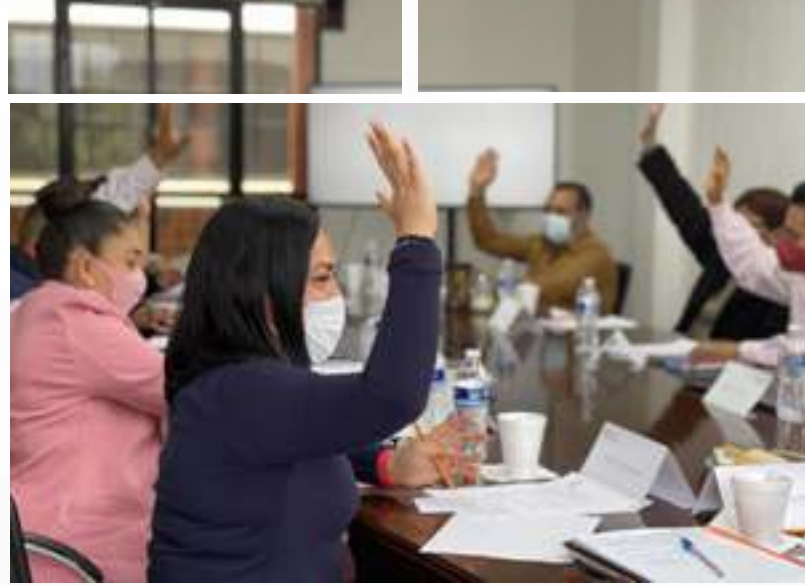
Sesiones de Cabildo

E N ESTA ÁREA SE ORGANIZA Y SE LLEVA A CABO CONJUNTAMENTE CON EL PRESIDENTE MUNICIPAL LAS POLÍTICAS INTERNAS DEL MUNICIPIO, LLEVANDO UN PUNTUAL SEGUIMIENTO DE LOS ACUERDOS QUE SE DECIDEN EN EL CABILDO, ADEMÁS DE VIGILAR EL CUMPLIMIENTO DE LOS MISMOS.